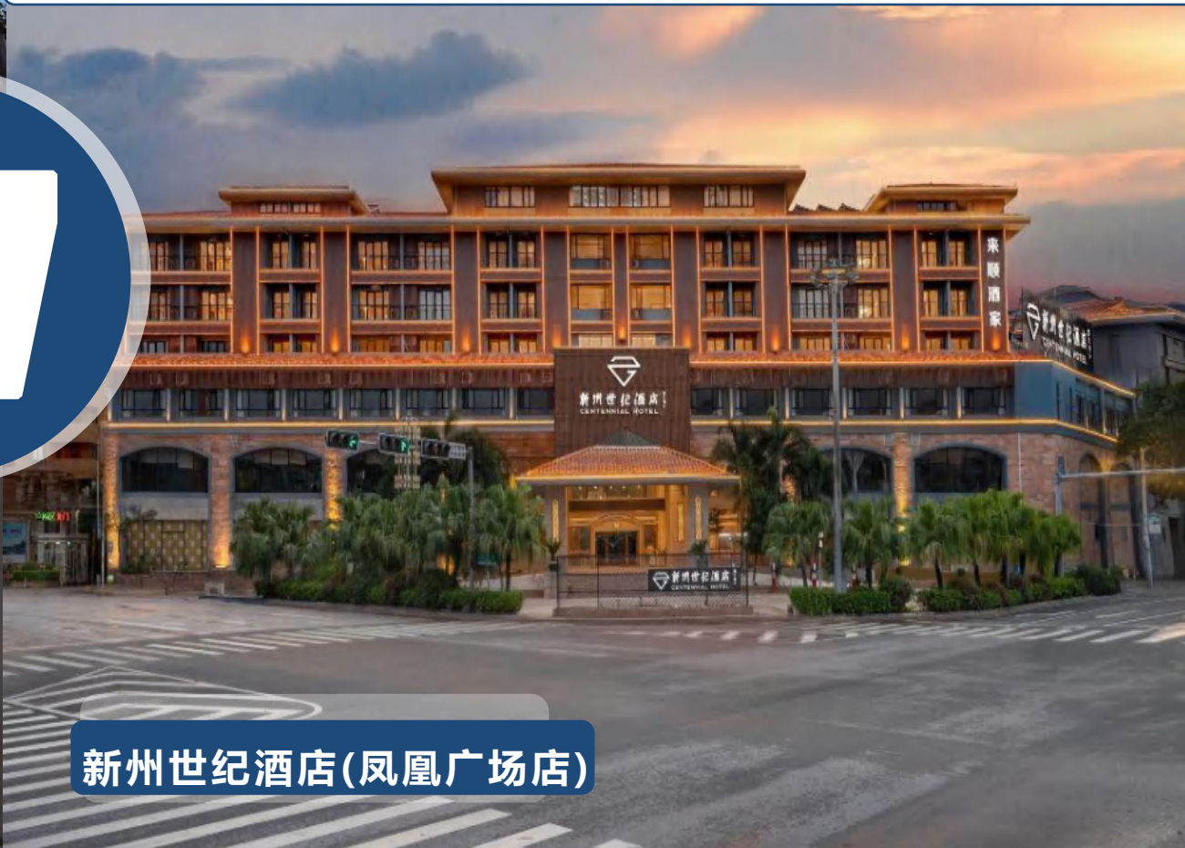
新州世纪酒店(凤凰广场店)