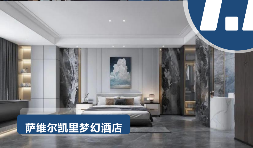
萨维尔凯里梦幻酒店